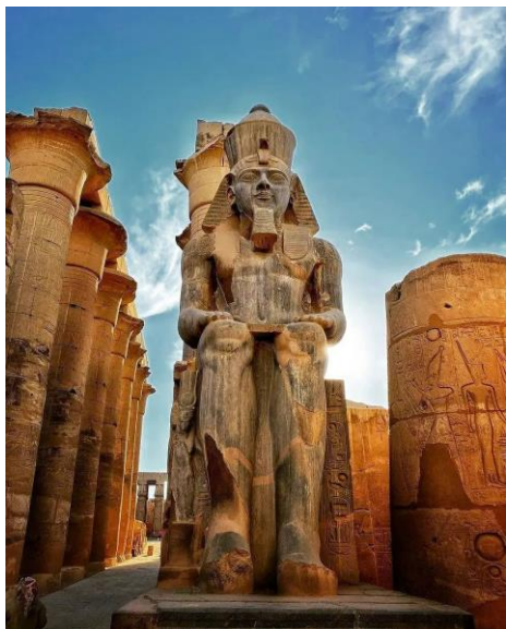
Statua Ramzesa II

Po dolasku u Luksor slijedi posjeta Luksorskom hramu – velikom staroegipatskom kompleksu hramova smještenom na obali rijeke Nil. Kompleks je izgrađen oko 1.400 godina pne, u vrijeme faraona Amenhotepa III i Ramzesa II, koji je dao izgraditi ulazne pilone i dva obeliska ispred njih. Jedan od njih je odnesen u Francusku i danas se nalazi u centru pariškog trga Place de la Concorde. Nakon obilaska kompleksa, slijedi ukrcavanje na brod. Večera na brodu. Noćenje.