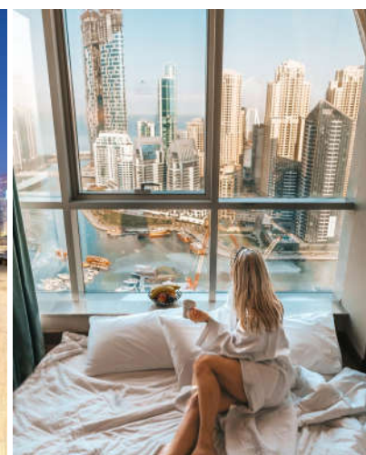
STELLA DI MARE 5*