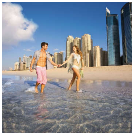
MOVENPICK JUMEIRAH BEACH 5*