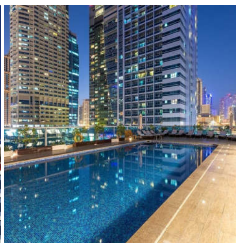
ARMADA BLUE BAY 4*