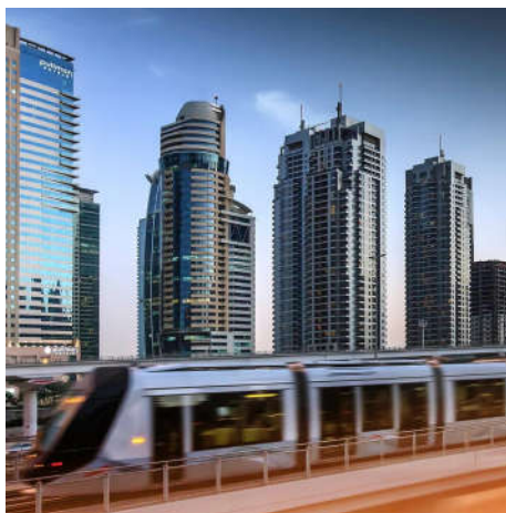
PULLMAN JUMEIRAH LAKES 5*