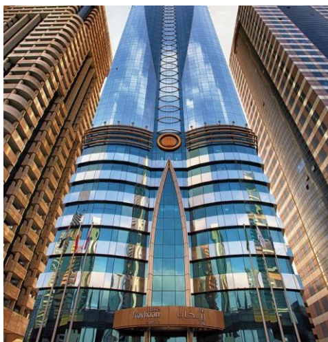
ROSE RAYHAAN BY ROTANA 5*