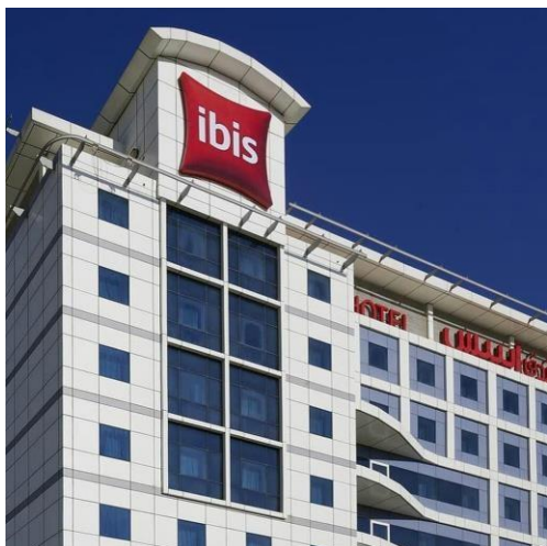
IBIS AL BARSHA 3*

Cijene su navedene u KM po osobi. Za bebe do 2 godine starosti plaća se 180,00 KM.