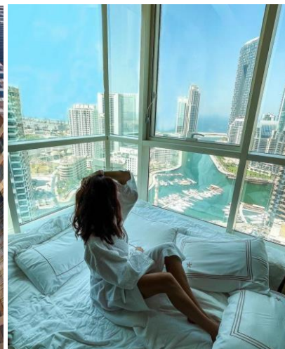
STELLA DI MARE 5*